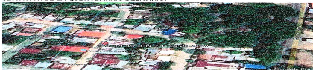
Figura N. º 1. Imagen Google Earth. "Punto de afectación ambiental en el barrio Belisario"

Mediante oficio SG- INT N°1661, por medio del cual se remite aquella Subdirección para que de acuerdo a sus competencias de cumplimiento al artículo segundo del mencionado acto administrativo.