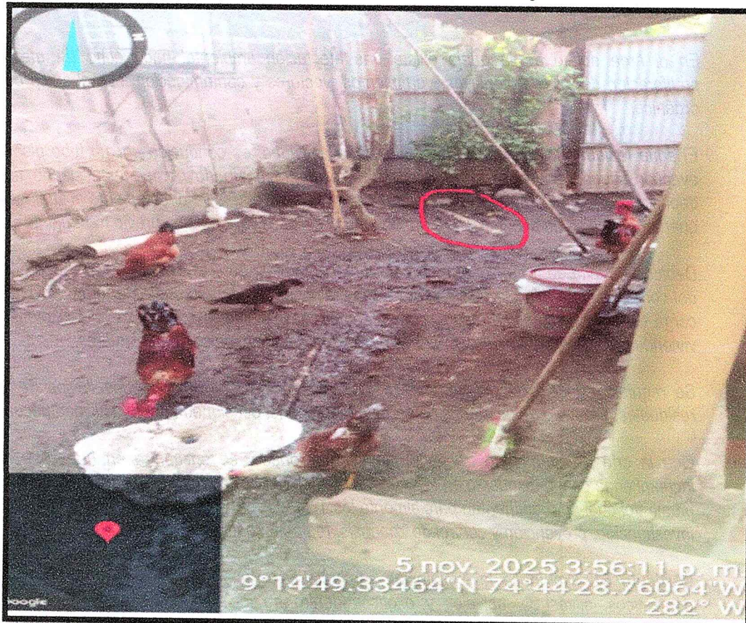
Figura N°2. Cuneta de vertimiento directo al suelo y tubo de drenaje.